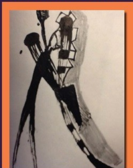
DISCANTO IN SAN FRANCISCO Sandro Sardella