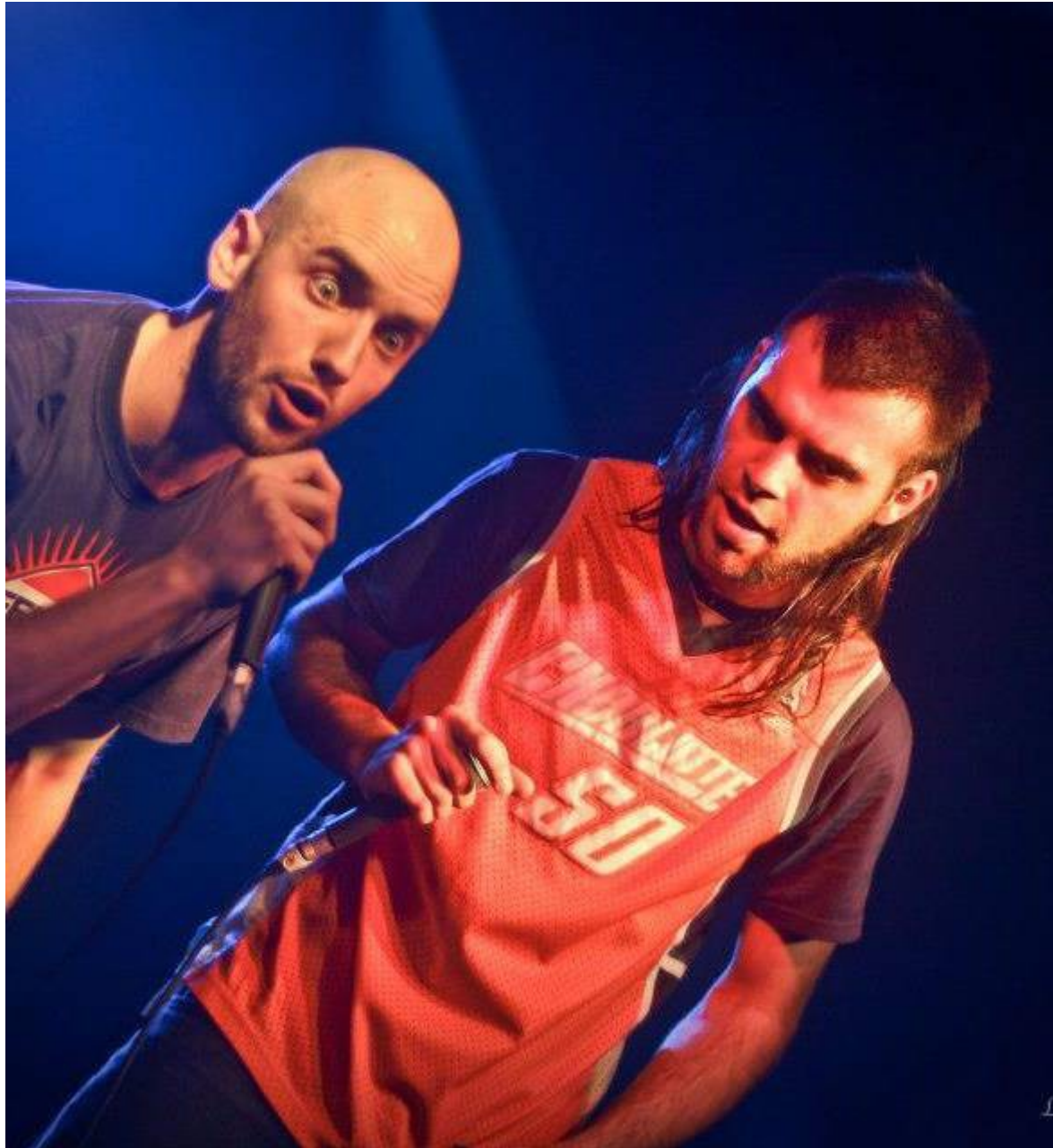
Scarty DOC&Tempo (alias EELL SHOUS)